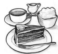
Kaffee und Kuchen

Am Freitag, den 13. März , um 14.30 Uhr ist wieder gemütliches Beisammensein mit Kaffee und Kuchen im Pfarrheim. Wir freuen uns über viele Besucher.