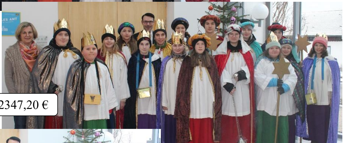
Taufkirchen: 2347,20 €