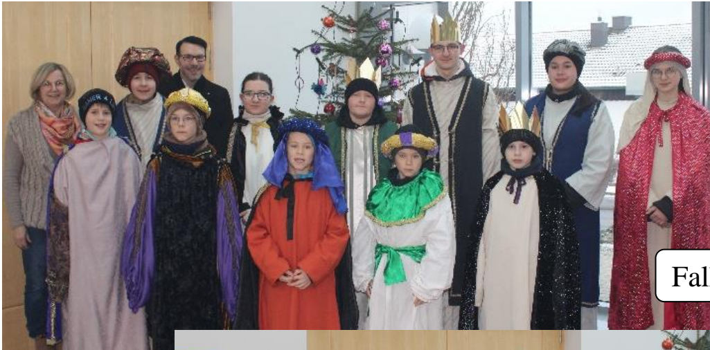
Falkenberg: 2041,10 €