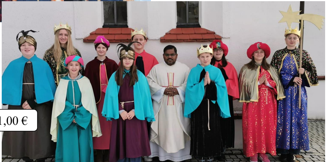
Rattenbach: 981,00 €