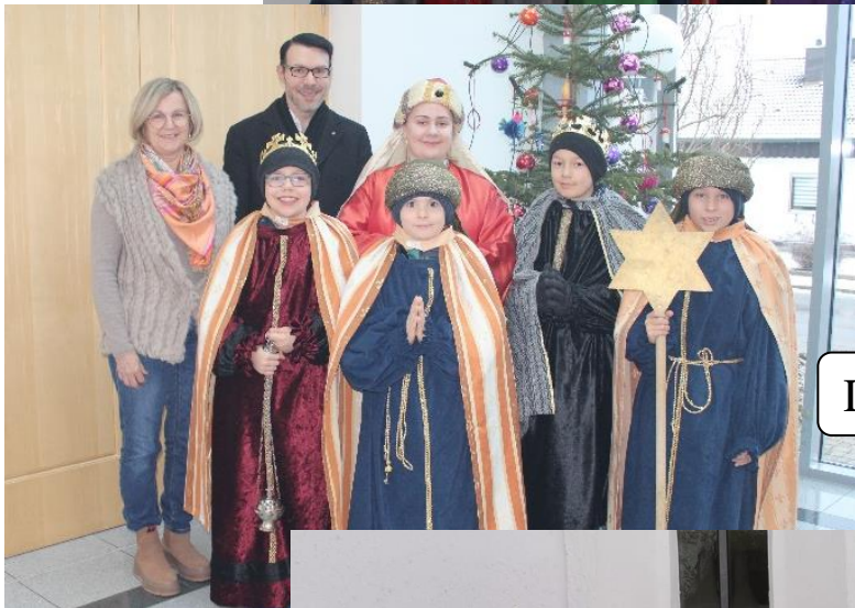
Diepoltskirchen: 754,52 €